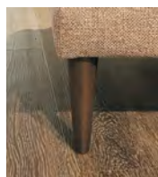
Alternativ-Fuß F226 Buche