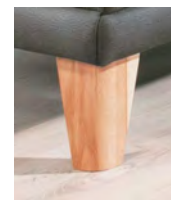
Alternativ-Fuß F147 Buche