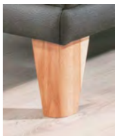
Alternativ-Fuß F147 Eiche