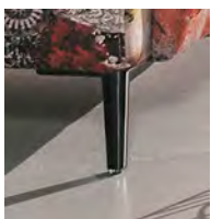
Standard-Fuß F171 schwarz-chrom